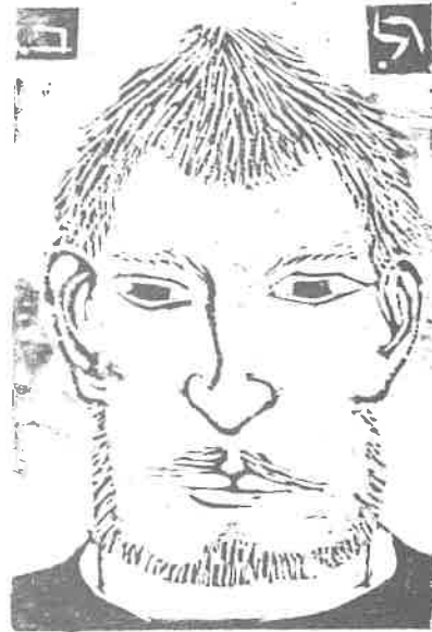
רודי להמן, פורטרט עצמי, חיתוך-עץ, 1969.

סדנת ההדפס ירושלים – מרכז פלורנס מילר לאמנות רחי שבטי ישראל 38, מורשה, ירושלים 95105, טל. 288614. מיסודן של אגודת הציירים והפסלים - אמני ירושלים ואגודת ידידי בית האמנים. סתיו 1985. קטלוג מסי' 12. כל הזכויות שמורות ©. לוחות והדפסה: דפוס יובל, ערושלים. סדר צילום: אסטרוניל, ירושלים.