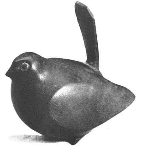
רודי להמן, ציפור, עץ, 1950.