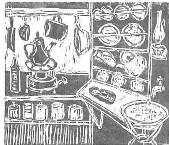
הדויג גרוסמן, פנים מטבח, חיתוך-עץ, 1960.