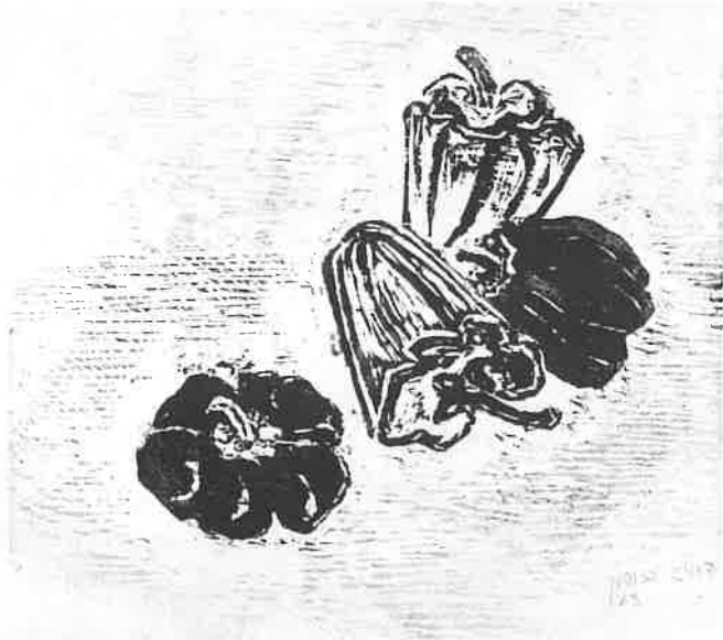
הדויג גרוסמן, פלפלים, חיתוך-עץ, 1963.